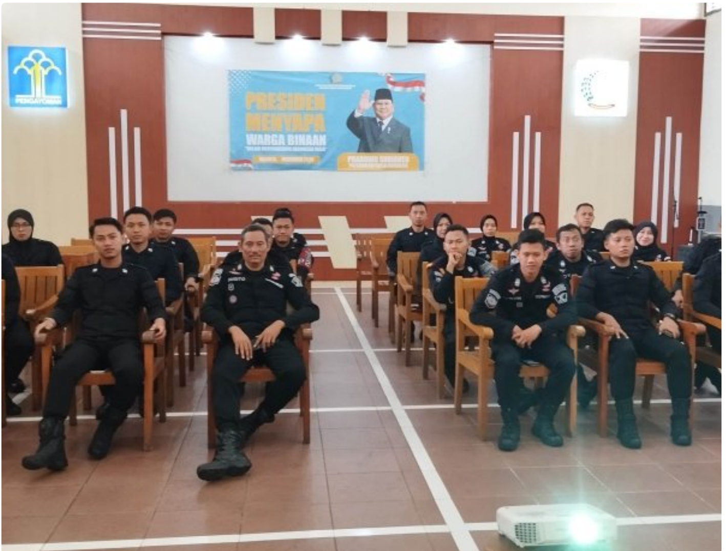
Rutan Blora Ikuti Sosialisasi Pedoman Uji Kompetensi Jabatan Fungsional Pembina Keamanan dan Pengaman Masyarakat

Blora - Rumah Tahanan Negara (Rutan) Kelas IIB Blora turut berpartisipasi dalam kegiatan Sosialisasi Pedoman Uji Kompetensi Jabatan Fungsional